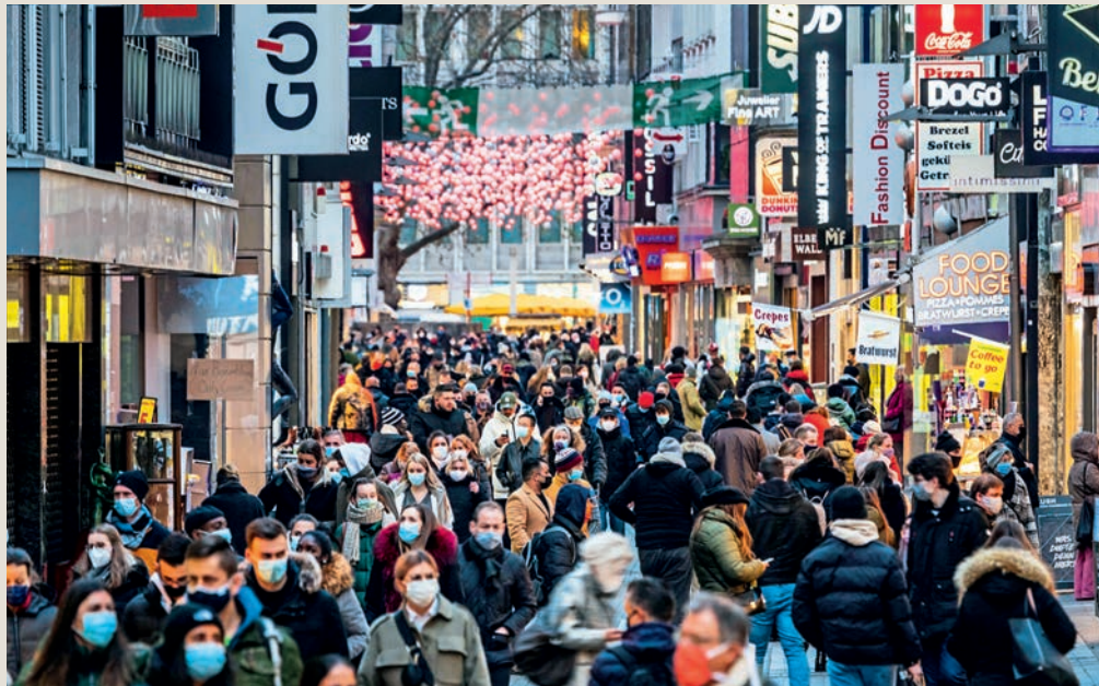
Auch im Alltag hat sich vieles verändert, Masken gehören zum Stadtbild

Dies zwingt die Menschen, sich häufiger zu kurzfristigen Themen zu informieren. Die wachsende Anzahl von Suchan-