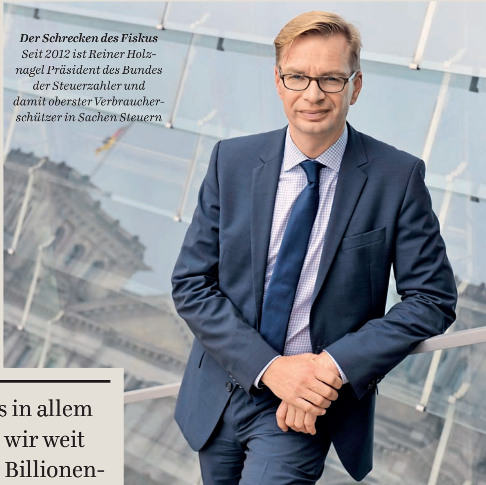
Der Schrecken des Fiskus Seit 2012 ist Reiner Holznagel Präsident des Bundes der Steuerzahler und damit oberster Verbraucherschützer in Sachen Steuern

Viele werden mit dieser Zahl wenig anfangen können. Wie hoch ist denn die Staatsverschuldung Deutschlands insgesamt? Mit unserer Schuldenuhr