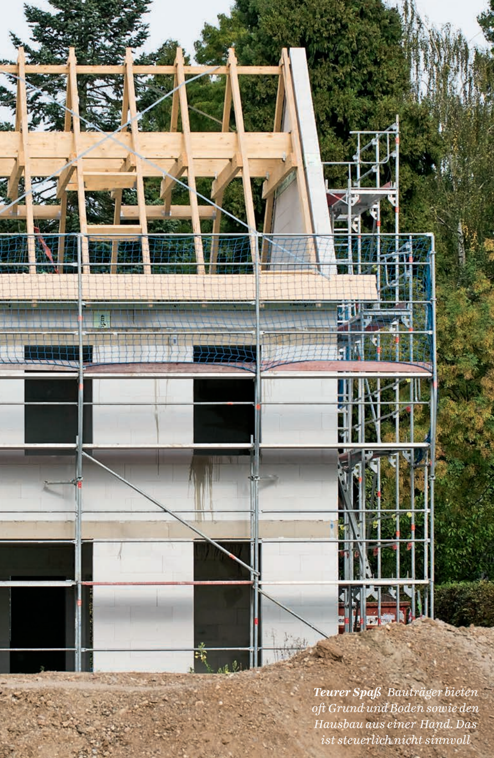
Teurer Spaß Bauträger bieten oft Grund und Boden sowie den Hausbau aus einer Hand. Das ist steuerlich nicht sinnvoll