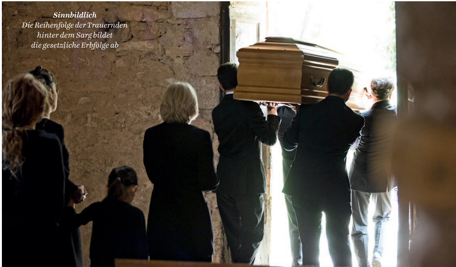
Sinnbildlich Die Reihenfolge der Trauernden hinter dem Sarg bildet die gesetzliche Erbfolge ab

Wer einigermaßen harmonisch das bürgerliche Familienmodell lebt, muss seinen Nachlass nicht zwingend regeln. Das Gesetz sorgt dafür, dass die nächsten Angehörigen erben